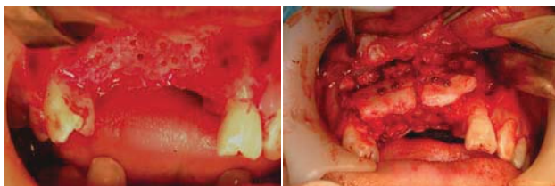
写真 3 術中写真：骨増生手術 (2005 年 4 月上旬)

2011 年 12 月下旬、メンテナンスのため近歯科医院に通院しており、電話で確認したところ現在動揺などなく良好な経過を得ている。