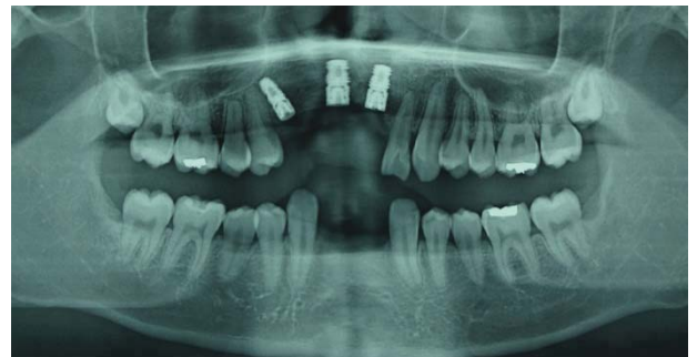
写真 5 インプラント埋入後のパノラマ X 線写真