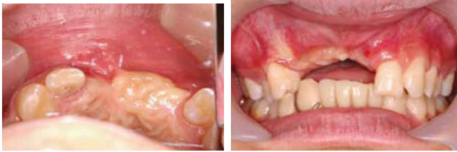
写真 2 退院後、当科受診時口腔内写真

321 | 123 に欠損を認め、上顎前歯部の歯槽骨は垂直的、水平的に骨量不足を認めた(写真 2)。